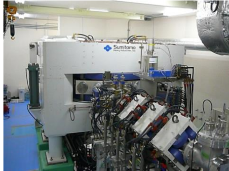
加速器BNCTシステムで用いられているサイクロトロン